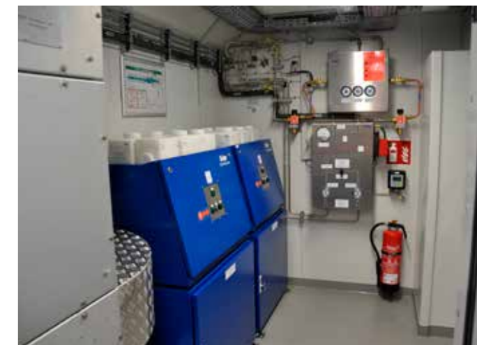
Bild li.: Die Patienten können liegend im Sanitätswagen behandelt werden; Bild re.: Zur Aufbereitung der unabhängigen Atemluftversorgung, stehen CO 2 Absorber in den Transportwägen zur Verfügung.

Bild li.: Eine Vielzahl an technischen Geräten und Ausrüstung zur Brandbekämpfung stehen den Feuerwehrkräften zur Verfügung; Bild re.: Die eingebaute Pumpe kann über zwei B-Abgänge die mitgeführten 20.000 Liter Wasser zur Einsatzstelle befördern.