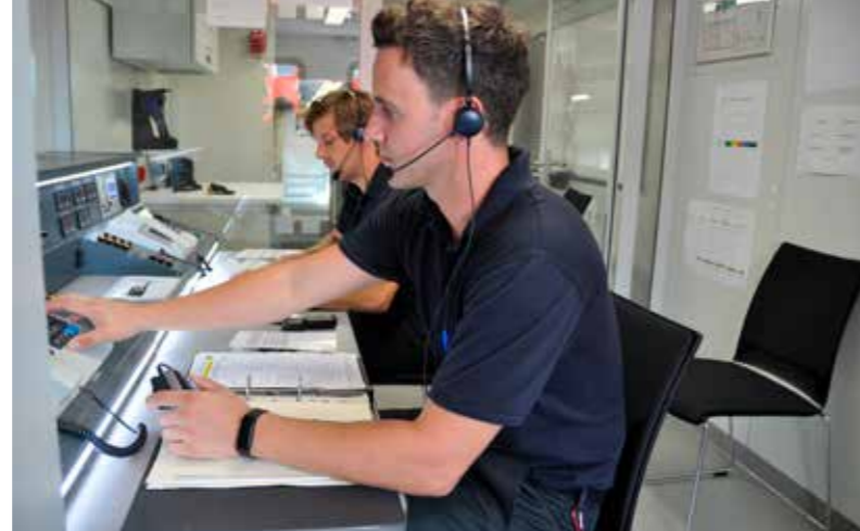
Bild li.: Mit Rollwagen können Geräte oder Verletzte auf den Schienen transportiert werden; Bild re.: An zwei Funkarbeitsplätzen wird die komplette Kommunikation mit den Rettungseinheiten abgewickelt.