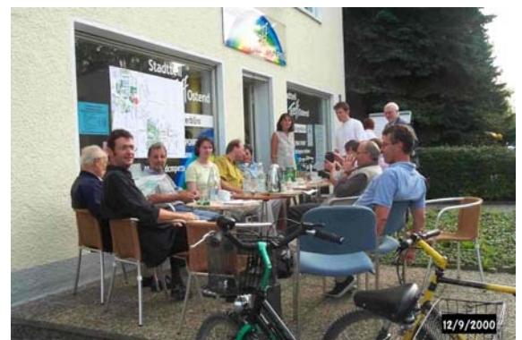
... auch öffentlich