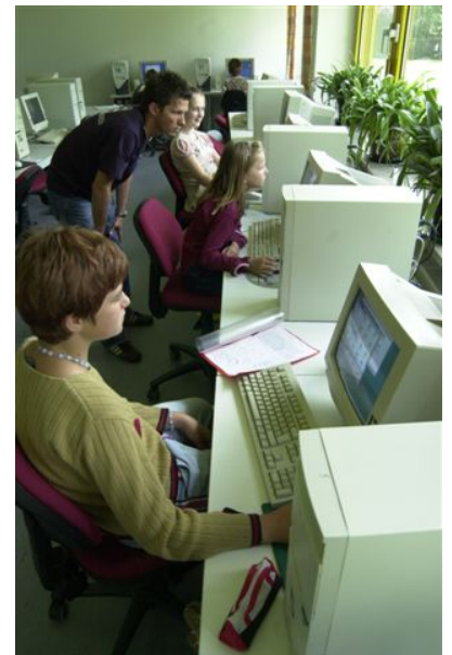
Computerkurs zur Qualifizierung der Bewohner