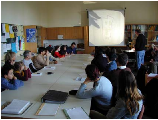
Beteiligungsprojekt Pausenhof Löweneckschule Eltern, Lehrer und Schüler sind selbst aktiv in der Planung...