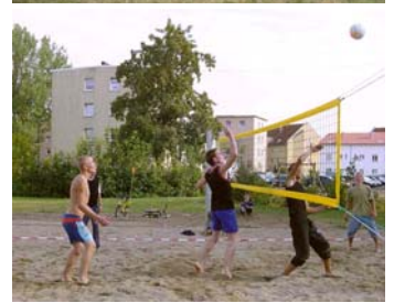
von der Arbeit zum Freizeitvergnügen

Von diesen sehr unterschiedlichen Vorbedingungen aus waren die Modellkommunen gehalten, die Basis für Beteiligungen – nach innen wie nach außen – in Form von integrierten Handlungskonzepten zu schaffen. Sie taten dies in unterschiedlicher Weise mit unterschiedlichen Erfahrungen, über die wir nachfolgend berichten, damit interessierte Kommunen das für sie Wichtige daraus ableiten können.