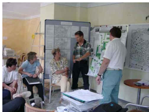
Die Arbeitskreise tagen ...