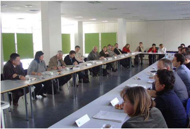
Vernetzungsveranstaltung an der Obersten Baubehörde

Damit Resümee und Schlussfolgerungen aus den Modell-erfahrungen auch für Kommunen außerhalb des Modell-versuchs nutzbar sind, werden die Erfahrungen in dieser Dokumentation niedergelegt.