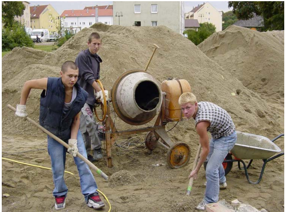
...bis zum Bauen (Beachvolleyballplatz in Neu-Ulm)

Gelungene diskursive Beteiligungen optimieren den Planungsverlauf und die Planungsergebnisse und bringen für Verwaltungen und Politik ebenso wie für Stadtaktive und Bevölkerung einen großen Lernvorteil mit sich, der sich im Gemeinwesen langfristig positiv auswirkt, z.B. durch Erhöhung des Interesses der Quartiersbevölkerung an Qualität und Profil des Quartiers, durch Beschleunigung von Planungs- und Umsetzungsprozessen oder einer günstigeren sozialen Atmosphäre sowie Nachbarschaft.