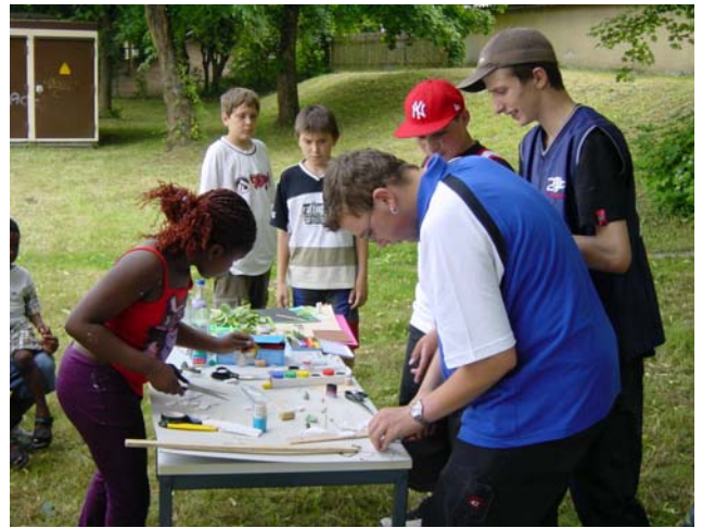
Jugend baut am Quartiersplatz in Neuburg-Ostend

Das Quartiersmanagement kann dafür Koordinations- oder Organisationsaufgaben übernehmen, sofern die angemessenen Beteiligungsformen und die inhaltlich-politischen Vorgaben von den zuständigen Kooperationspartnern, wie z.B. Wirtschaftsförderung (= Beteiligung nach innen) und Industrie- und Handelskammer, Handwerkskammer, Händler und Gewerbetreibende (= Beteiligung nach außen) definiert und bedient werden.