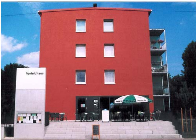
Vorfeldhaus in Neu-Ulm als räumliches und funktionales Quartierszentrum