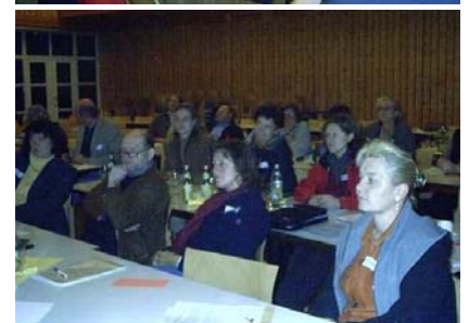
Beteiligung in Neumarkt i.d. Oberpfalz