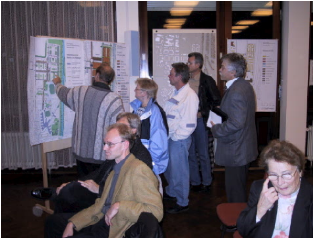
Informationsveranstaltung in Augsburg