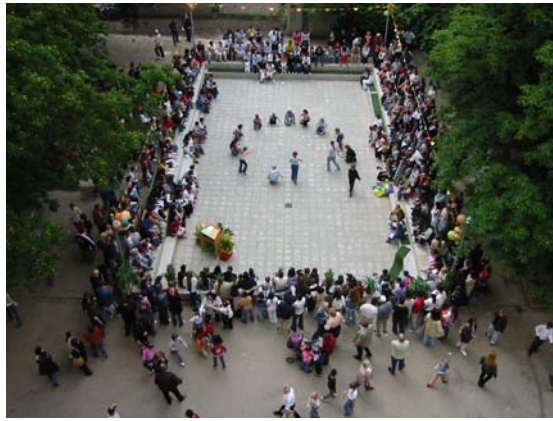
...und feiern gemeinsam das gelungene Ergebnis