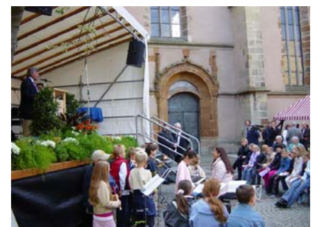
Die Bürger der Stadt Neumarkt feiern...

In Neumarkt zählt die gesamte Altstadt zum Programmgebiet Soziale Stadt. Die vorbereitende sozialräumliche Analyse, bei der erste Beteiligungsaktivitäten realisiert werden konnten, ist kürzlich erst abgeschlossen worden. Als nächster Schritt steht nun die dialogische Erarbeitung des Integrierten Handlungskonzepts an.