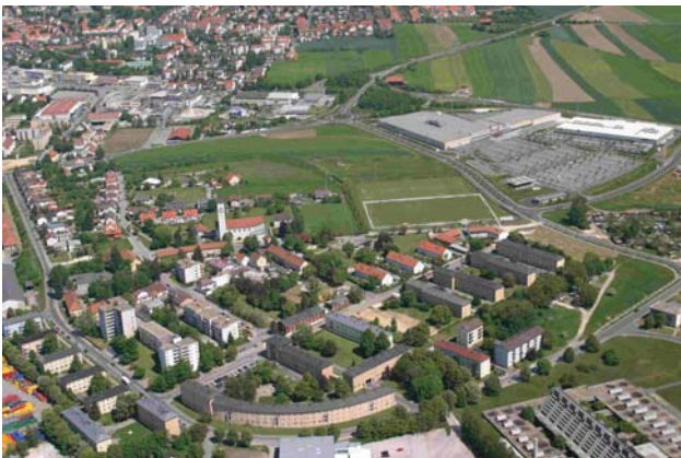
Luftbild Siedlung Am Bergsteig

Die Ursprünge der Siedlung „Am Bergsteig“ liegen in den fünfziger Jahren, als eine Verfügung die Räumung der mit Vertriebenen und Flüchtlingen belegten Kasernen bestimmte. Darauf hin wurden als vorübergehender Wohnraum zwölf Holzbaracken im Siedlungsgebiet zur Verfügung gestellt. In den folgenden Jahren wurden vom Bund nach Abriss der Holzbaracken mehrere Wohnblocks in Einfachbauweise errichtet. Verschiedene Mehrfamilienhäuser sind durch die Stadtbau Amberg GmbH und eine weitere Wohnungsbaugesellschaft später im Siedlungsgebiet ergänzt worden.