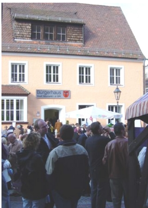
Einweihung des neuen ‚Bürgerhauses‘ in Neumarkt/Opf.

Wie der Diskurs in Beteiligungsverfahren zu gestalten ist, richtet sich, wie oben gesagt, nach dem Willen der Stadt und nach der Befindlichkeit der einzubeziehenden Öffentlichkeit(en). Neben Anspruch und Ausdrucksfähigkeit der Gruppierungen spielt auch die Betroffenheit der Einzelnen durch eine planerische Maßnahme und das daraus resultierende Engagement, an diskursiven Beteiligungsangeboten tatsächlich aktiv mitzuwirken, eine Rolle. Beteiligungsangebote sind weder für Kommunen, noch für Bürgerinnen und Bürger ein Selbstzweck. Niemand nimmt diese zeitaufwendigen Beteiligungsangebote grundlos oder uneigennützig wahr. Warum sollte sie oder er auch? Die Kommune sollte genauso profitieren wie die Bürgerschaft.