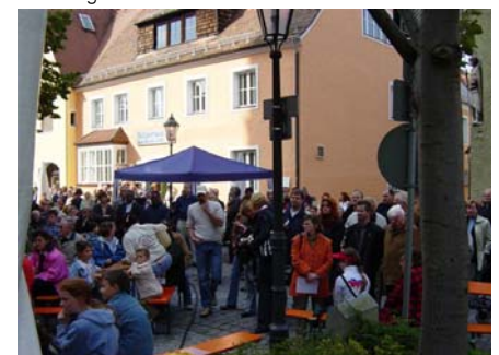
...ihr neues Bürgerhaus (im Hintergrund)