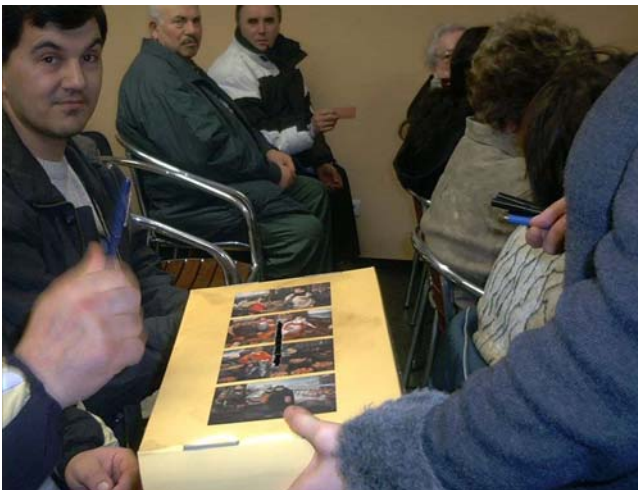
Wahl eines Bürgerbeirats (z.B. in Rosenheim)

Für die regelmäßige Zusammenarbeit mit Bürgerschaft und Stadtaktiven werden üblicherweise Stadtteilforen oder Stadtteil-Arbeitskreise ins Leben gerufen. Diese neuen Formen der Zusammenarbeit können – anfangs noch – durch bürokratische und hierarchische Strukturen erschwert werden.