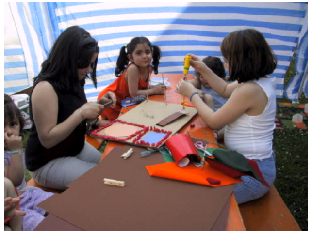
Kinder entwerfen ihren Quartiersplatz

Dank einer stringenten Projektstruktur (Projekthandbuch, Integriertes Handlungskonzept mit Stadtratsbeschluss unterlegt, Beteiligung von Stadträten in Lenkungsgruppe und Stadtteilarbeitskreis) konnte das Projekt nach der Kommunalwahl mit parteipolitischen Veränderungen in der Stadtspitze ohne Einschnitte fortgeführt werden. Die Stadtpolitik erwartet sichtbare Ergebnisse im Stadtteil, alle Fraktionen sind sich einig, dass „etwas im Stadtteil passieren“ muss. Daher besteht gegenwärtig Druck für eine schnelle Programmumsetzung zu sorgen. Mittlerweile melden sogar bereits die anderen Stadtteile Augsburgs starkes Interesse an ähnlichen Planungsleistungen und Aktivitäten an, so dass der Stadtteil Oberhausen-Nord und das Programm Soziale Stadt Pilotfunktion übernehmen und auf die gesamtstädtische Planung ausstrahlen. Die gesamtstädtische Sicht auf das Programmgebiet hat sich während der nun fast 5 Jahren Laufdauer von starker Skepsis und Vorbehalten bereits ins Positive gewandelt.