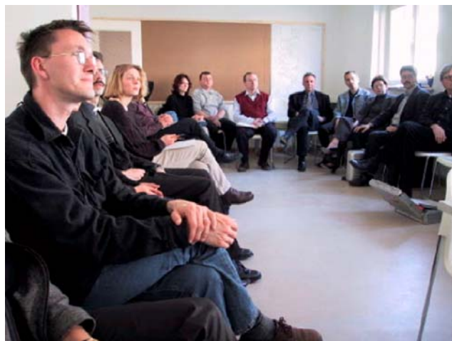
Stadtteilarbeitskreis in Augsburg-Oberhausen

Mit diesen neuen Formen organisierter Verständigung wird dem demokratischen Verständnis von Mit- und Selbstbestimmung in der Öffentlichkeit entsprochen. Der möglicherweise entscheidende Grund, neue Partizipationsformen anzuwenden, liegt aber darin, dass die zunehmende Komplexität und Konfliktlage der Planungs-Sachverhalte und die (mit vernetztem Handeln oft) überforderte Bürokratie zum ‚Brückenschlag‘ mit Bürgerschaft / Stadtaktiven angeregt wird. Beteiligungsprojekte stellen in diesem Sinne auch einen Baustein auf dem Weg zu mehr Bürgerorientierung der Kommunen dar und werden durch Impulse in anderen Handlungsfeldern, wie z.B. stärkere Kundenorientierung der Verwaltung, Organisation des bürgerschaftlichen Engagement (z.B. durch Koordinierungsstellen, in denen Bürger/innen partnerschaftlich angesprochen werden), ergänzt. Sie sind im Zusammenhang mit einem administrativen Verständnis vom ‚aktivierenden Staat‘ bzw. der ‚ermöglichenden Verwaltung‘ zu sehen. 15