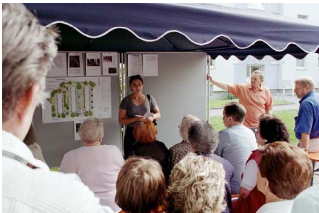
Langjährige Bewohner bringen ihre Erfahrungen und Wünsche mit ein

sozial, wirtschaftlich, kulturell, infrastrukturell) verbessert. Weil nicht alle diese Verbesserungen von der Kommune geleistet werden sollen und können, sollen sich auch private Investor/innen, soziale Einrichtungen/Träger und die Bewohnerschaft selbst motiviert fühlen, sich – z.B. in gemeinsamen Initiativen, Projekten und Maßnahmen – zu engagieren und sich dort möglichst dauerhaft selbst zu organisieren, so lautet jedenfalls die idealtypische Vorstellung. Die organisatorische und konzeptionelle Verklammerung zwischen verschiedenen Maßnahmen und Projekten wird in Soziale Stadt-Projekten durch die genannten integrierten Handlungskonzepte auf der Sachebene und die Lenkungs- bzw. Projektgruppe personell geschaffen. Sie sollte sich im Förderzeitraum soweit konsolidieren, dass das Erreichte auch nach Ablauf der Förderung der Erneuerungsmaßnahme ohne Bruch weitergeführt werden kann.