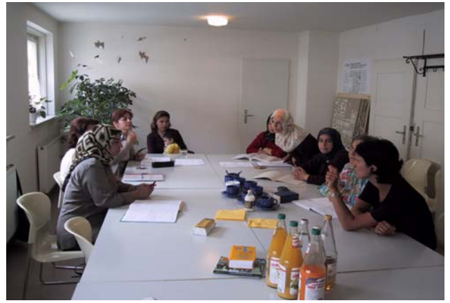
Stadtteiltreff Oberhausen - Alltagsdeutsch für türkische Frauen

Die Wohnungsbaugesellschaft bzw. der Projektsteuerer nutzen nach eigener Aussage diese Aktivierungsarbeit des Quartiersmanagements, um die Quartiersbevölkerung, beispielsweise an Planungen und an der Umsetzung von Maßnahmen, zu beteiligen. Es wurden aber bisweilen „fertige Planungen“ von der Anwohnerschaft abgelehnt, obwohl Pläne und Ideen zur Einsicht im Quartiersbüro aushingen und bei Quartiersbeiratssitzungen erläutert wurden. Möglicherweise war die Informationspolitik über Umgestaltungsmaßnahmen nicht angemessen, so dass zeitweise Missstimmungen in der Bevölkerung gegenüber öffentlichen Stellen und Wohnbaugesellschaft festgestellt worden waren, die dann durch einen gemeinsamen informierenden Rundgang mit Hausbesuchen des Prokuristen der Wohnungsbaugesellschaft und des Quartiersmanagers bereinigt wurden.