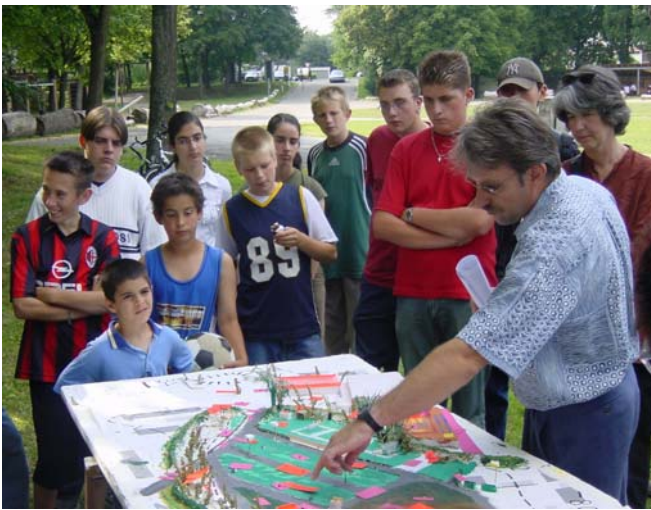
Beteiligung von Kindern und Jugendlichen in Neuburg a.d. Donau

Möglicherweise wollen alle diese unterschiedlichen Gruppierungen mitdenken, mitsprechen, mitwirken – was im Sinne des Soziale Stadt-Programms geradezu ideal wäre. Sie haben in der Regel jeweils