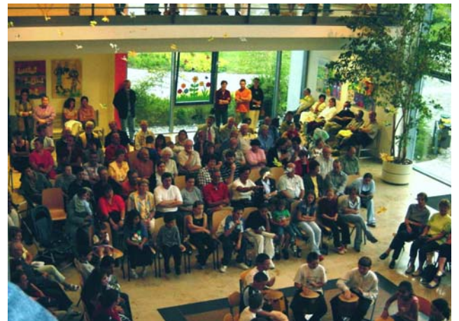
Stadtteilversammlung im Ostend

Im Soziale Stadt-Gebiet Ostend sind bisher Stadtteilstefeste, Stadtteilversammlungen und eine Zukunftswerkstatt durchgeführt worden. Es haben sich themenspezifische Arbeitskreise gebildet, die regelmäßig tagen.