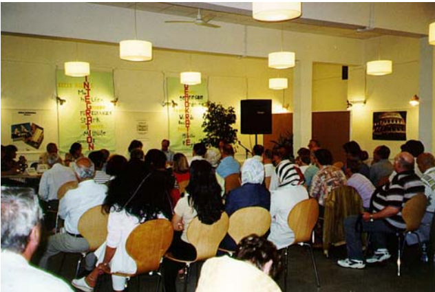
Bürgerversammlung in Ingolstadt