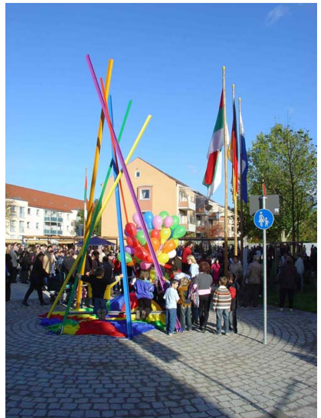
Einweihung des Drei-Auen-Platzes als neues Zentrum des Quartiers