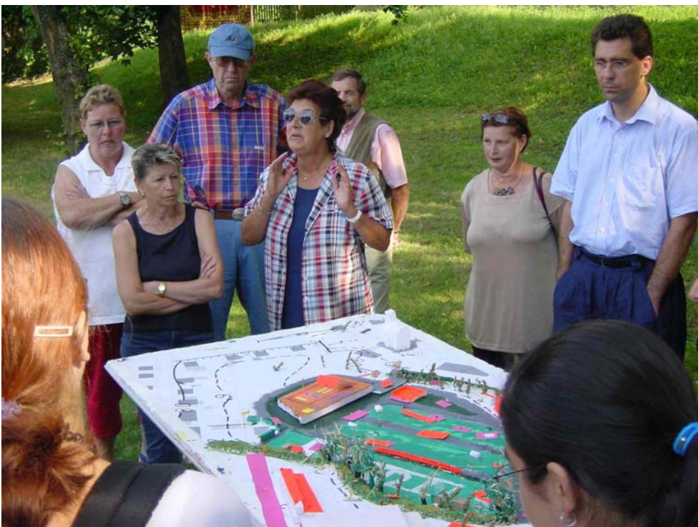
Einbindung der Bürger in die Projekte – von der Planung (z.B. in Neuburg a.d. Donau) ...