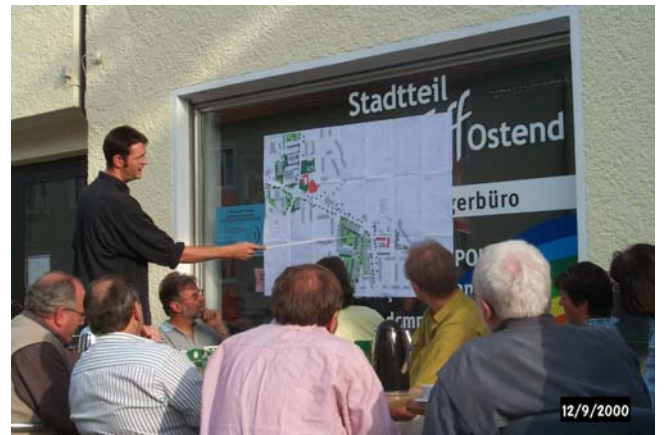
Planungen werden vor Ort und öffentlich diskutiert Arbeitskreis im Neuburger Ostend

Eine professionelle Prozessbegleitung macht auf die zahlreichen sensiblen Punkte in der Beteiligung aufmerksam, hilft, Konfliktpotentiale zu bearbeiten, Lösungswege zu identifizieren und Projekte vorausschauend zu konzipieren.