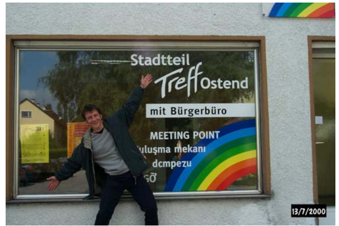
Stadtteiltreff Ostend in Neuburg a.d. Donau