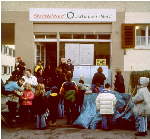
Stadtteiltreff Oberhausen-Nord in Augsburg als Ausgangspunkt für gemeinsame Aktionen

Erfahrungen mit Stadtteil- oder Quartiersmanagements werden seit Jahrzehnten im Rahmen der Gemeinwesenarbeit in sozial benachteiligten Quartieren gesammelt 37 . Leitziele der Gemeinwesenarbeit sind einerseits das „Empowerment“ der Bewohnerschaft, d.h. Hilfe zur Selbsthilfe, und andererseits die materielle und infrastrukturelle Ausstattung des Gebietes zu fördern. Das gilt auch in Projekten der Sozialen Stadt, in denen die städtebauliche Sanierung durch soziale Aufwertungsmaßnahmen ergänzt wird.