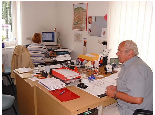
Quartiersmanagement in Amberg

Nachdem die Besonderheiten des Soziale Stadt-Programms, von Diskurs / Dialog und von Öffentlichkeit / Bürgerschaft beschrieben und diskutiert wurden, sollen die empirischen Befunde des Modellversuchs Diskursive Bürgerbeteiligung selbst vorgestellt werden. Wir beginnen mit einer Beschreibung der Rahmenbedingungen in Klein- und Mittelstädten, bevor wir die sechs Modellkommunen mit ihren unterschiedlichen Gebieten, Problemlagen, Beteiligungserfahrungen, Integrierten Handlungskonzepten und Beteiligungsprojekten vorstellen.